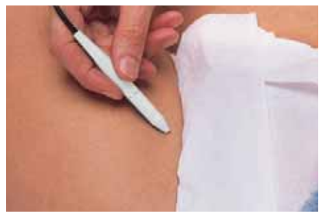
Depilación en ingie