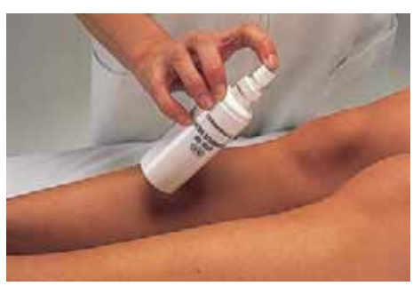
Pulverización de loción retardadora de vello