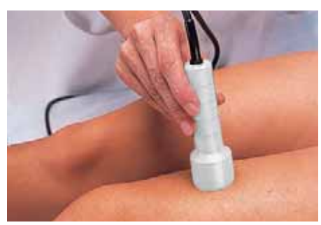
Depilación por sonda